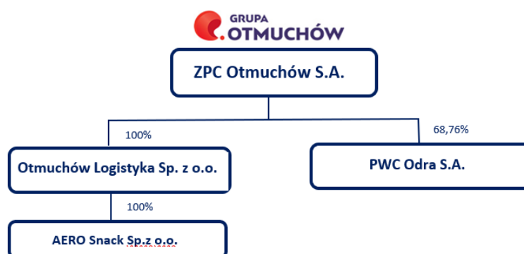
DIAGRAM 1 STRUKTURA GRUPY KAPITAŁOWEJ NA DZIEŃ PUBLIKACJI

W pozostałym zakresie w trakcie 2018 roku oraz do dnia sporządzenia niniejszego sprawozdania nie miały miejsca inne zmiany organizacji Grupy Otmuchów, w tym w wyniku połączenia jednostek, uzyskania lub utraty kontroli nad jednostkami zależnymi oraz inwestycjami długoterminowymi, a także podziału, restrukturyzacji lub zaniechania działalności.